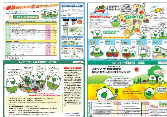
子ども環境家計簿（食育編）【おとな版】

エコ出前教室の際には親子で取り組める「ふくおか子ども環境家計簿（食育編）」を配付し、保護者と共に実践してもらいます。