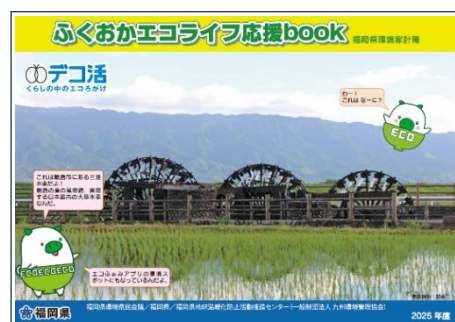
福岡県環境家計簿 2025 年度版