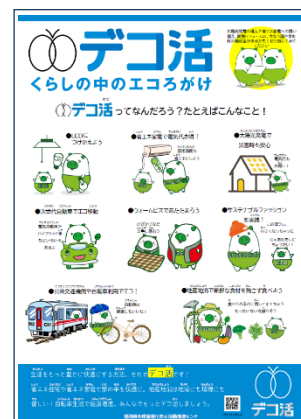
啓発資材（デコ活パネル）