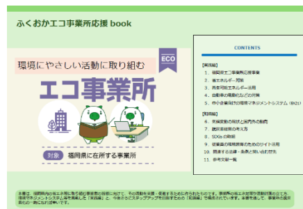
ふくおかエコ事業所応援 book