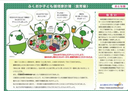
ふくおか子ども環境家計簿食育編 (おとな版)

「おとな版」には、より詳しく解説しております。切り取った後の「こども版」と一緒に、保存版として、今後もご活用いただければ幸いです。