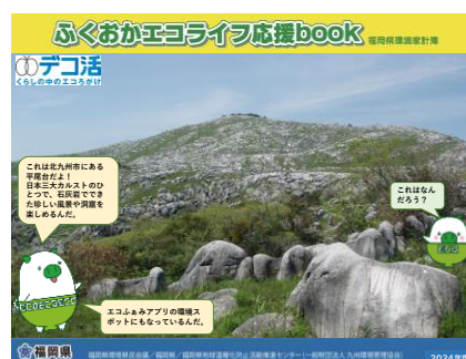
福岡県環境家計簿 2024 年度版