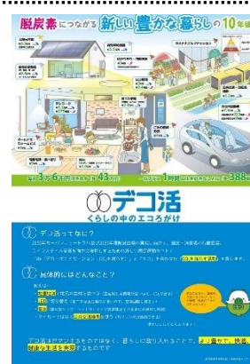
啓発資材（エコ活パネル）