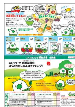
子ども環境家計簿食育編