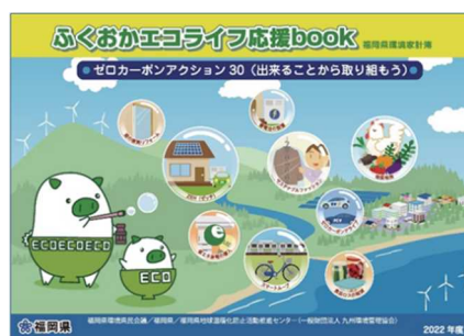
福岡県環境家計簿県民編 2022 年度版