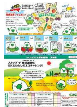
子ども環境家計簿食育編