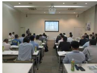
環境マイスターによる講演