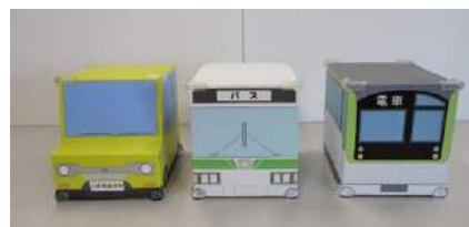
CO 2 排出量体験模型（2020年作製）