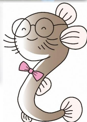
どじょうクラブマスコット