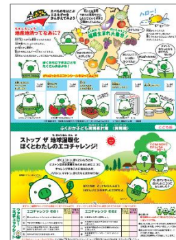
子ども環境家計簿食育編

次世代を担う子供たちを対象に、地球温暖化問題やエコ活動の実践についてを学ぶ講座を50回開催します。講座の際に、家で子どもたちでも実践できるエコ活動を掲載した「子ども環境家計簿」を配布し、家庭で保護者と共にエコ活動を実践してもらいます。また希望の園には、エコトンの絵が入った温暖化防止に関するメッセージ入りの年賀はがきを配布し、園児から祖父母に送ることで、三世代における地球温暖化対策の実践を促進します。