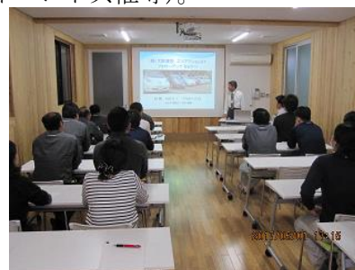
環境マイスターによる社員研修

地域環境協議会にオブザーバーとして参加し、資料提供、各主体の取組、主体間連携を促進します。