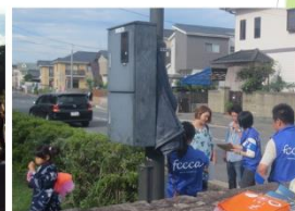
行政・温防センター・推進員の協働