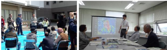
行政・温防センター・推進員の協働