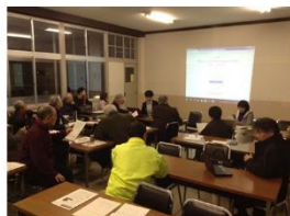
行政・温防センター・推進員の協働