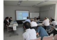
行政・温防センター・推進員の協働