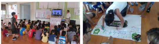
行政・温防センター・推進員の協働