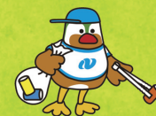
2014 長崎県 犬舎キャラクター がんばくん(長崎県)