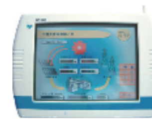
図7-2 太陽光発電と組み合わせたモニター例

さらに、現在では、ITを活用してネットワークでつなぎ、ホームコントローラー端末で内外の電気供給や電気自動車を含めた家庭全体での電力需給最適制御システムが研究・開発されています。