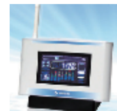
図7-1 家庭用省エネナビの例

その他にも家庭や事業所での消費電力量をリアルタイムで計測する「省エネナビ」や、太陽光発電量と組み合わせた「発電モニター」などがあり、エネルギーの「見える化」によって利用者に省エネ行動を促す機能を備えたものが開発され、普及が進められています。