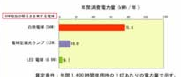
図1-4 各電球の消費電力量比較