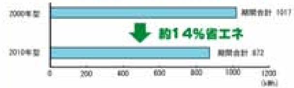
図1-2 10年前のエアコンとの期間消費電力量の比較