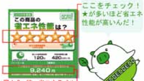
図1-3 統一省エネラベル 年間の電気料金の目安もわかります。