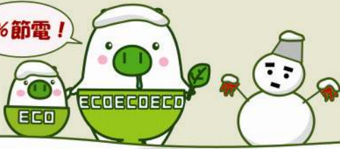
冬期平日の電気の使われ方 (イメージ)