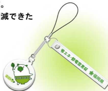
エコトンストラップ

省エネ節電宣言をされた県民の皆様へサービスをご提供いただける協賛企業を募集しています。ご協力いただける企業は福岡県環境保全課までご連絡ください。